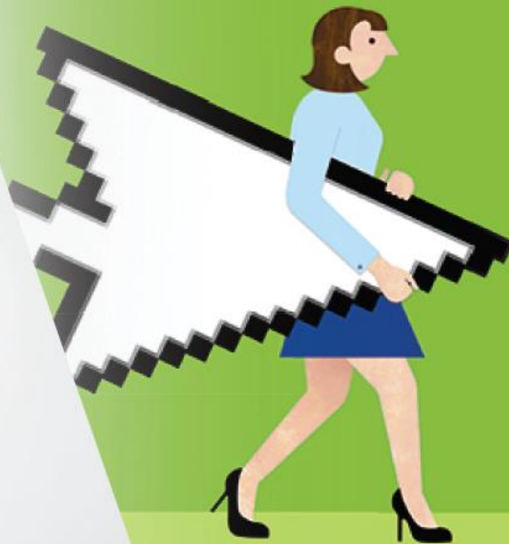
Ilustração: Gemma Robonson

Inclusive a criança, de cometer ato infracional, passíveis de aplicação de medidas sócio-educativas , tais como: advertência, obrigação de reparar o dano, prestação de serviços a comunidade, inserção em regime de semi- liberdade, internação em estabelecimento educacional e outras previstas nos artigos 101 e 105 do mesmo Estatuto.