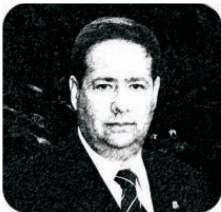
"... falta propósito negocial..."

de empresa, com o intuito de aproveitamento de juros sobre empréstimos; operação "casa e separa", para reduzir ou eliminar o ganho de capital na transferência de controle societário; a importação de bens através de "tradings" para fugir da incidência do IPI nas operações subsequentes; a criação de unidades de distribuição em outros estados, para aproveitamento de benefícios fiscais; a transformação de empresas atacadistas, varejistas ou industriais em exportadoras, para fins de recebimento e utilização de créditos de PIS, COFINS E ICMS; criação de